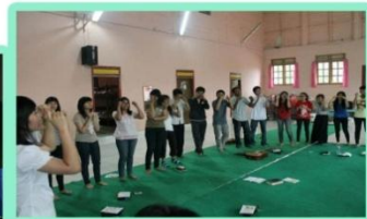
Regangan badan dengan games