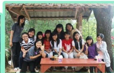
cewek-cewek pmk dari berbagai angkatan lagi ngumpul :)