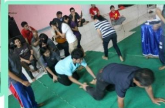
Seru-seruan bareng main games