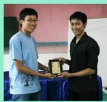
Ketua panitia memberikan plakat