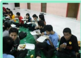
Yang kelaparan pasti makan nya banyak sekali :D