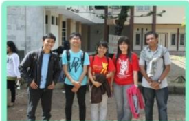
Menunggu bus di depan Balla

Puji Tuhan, Paskah PMK FK-FKG boleh terlaksana dengan baik. Kegiatan Paskah yang bertemakan : "Kasih yang Nyata" ini dilaksanakan pada tanggal 5-6 Mei 2012 di Bulu Tana, Malino.