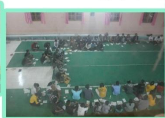
Suasana ibadah KKR tampak dari atas